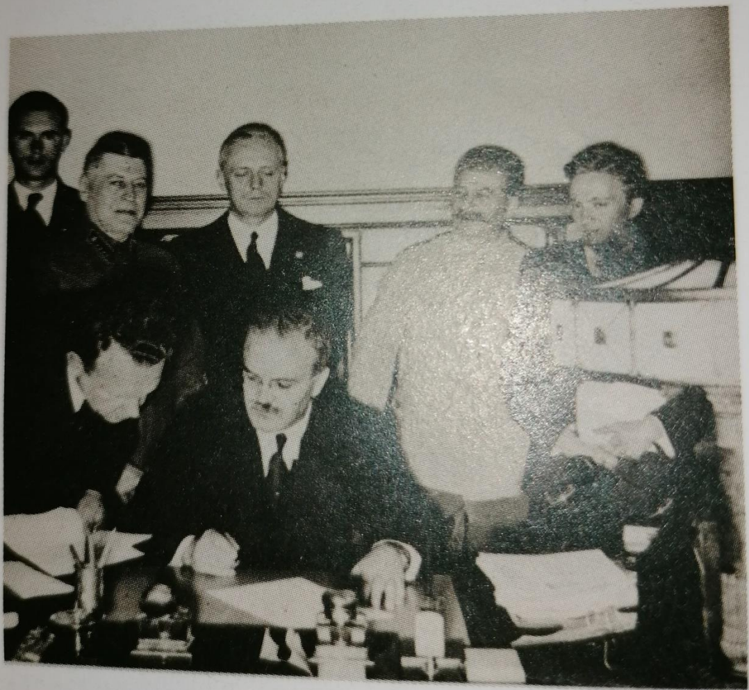
Потписивање пакта између СССР-а и нацистичке Немачке